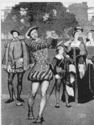
LE GOLF EN ECOSSE

Suite de la série historique sur le golf.