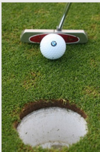
BMW Golf Cup France

Le BMW Golf Trophy, compétition à laquelle j'ai participé l'an passé en qualification à Bresson et lors de la finale nationale à La Baule change désormais de nom.