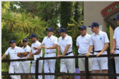
Les pros du Club Med

2ème article ayant pour sujet la semaine Passion-Golf pour laquelle j'ai été invité au Club Med d'Opio . Cette fois : l'entraînement et les démos.