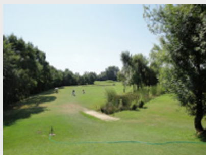
Golf de las Martines

Et aujourd'hui, je viens vous faire le compte-rendu de ces 15 jours de vacances bien méritées, aussi bien au niveau de l'hébergement qu'au niveau des golfs que nous avons joué.